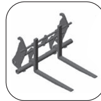
Вилы с Быстростъемным Механизмом