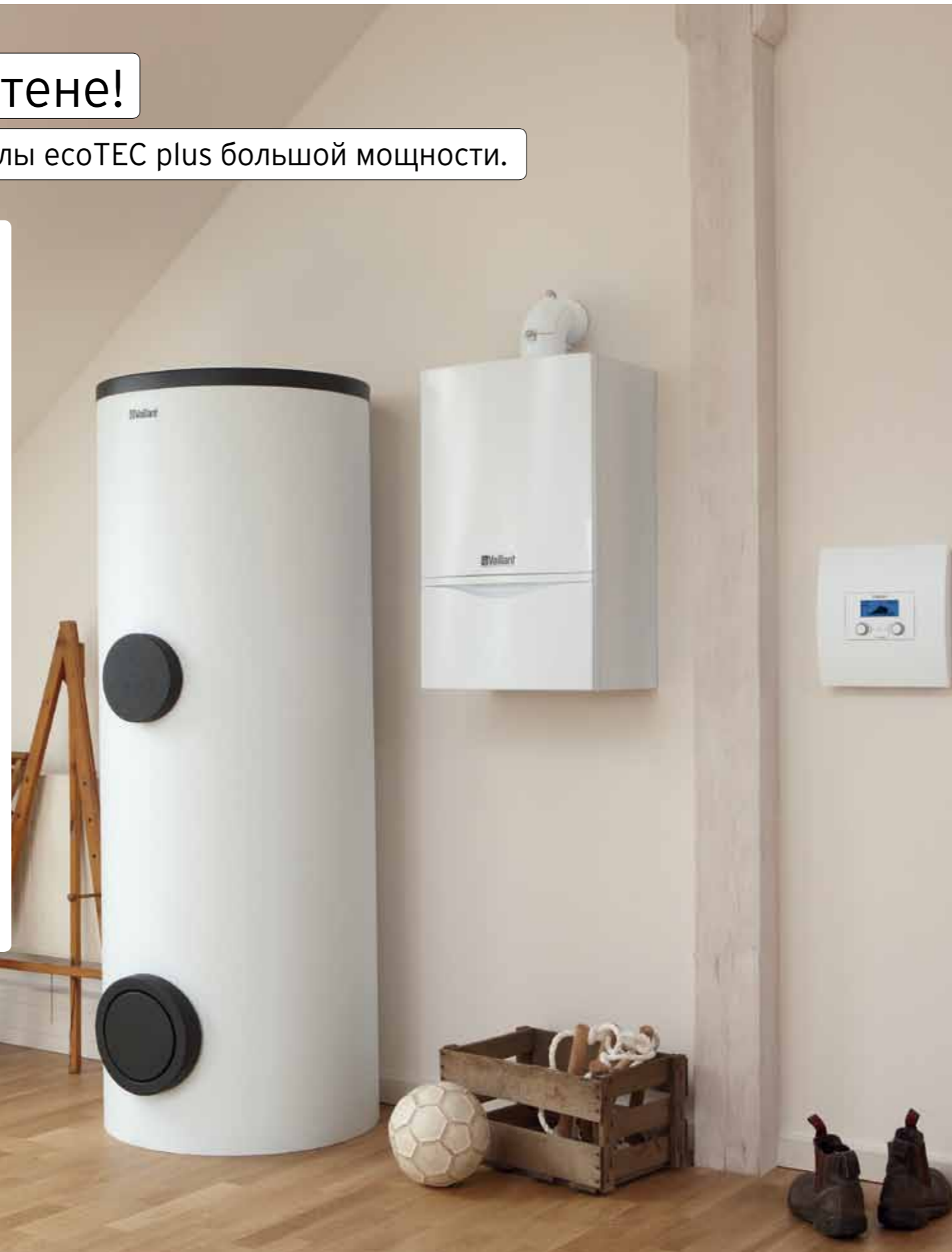
Котёл ecoTEC plus, водонагреватель uniSTOR, устройство регулирования calorMATIC 630/2

* Если иного не требуют местные нормы и правила ** Вычисляется по низшей теплоте сгорания топлива